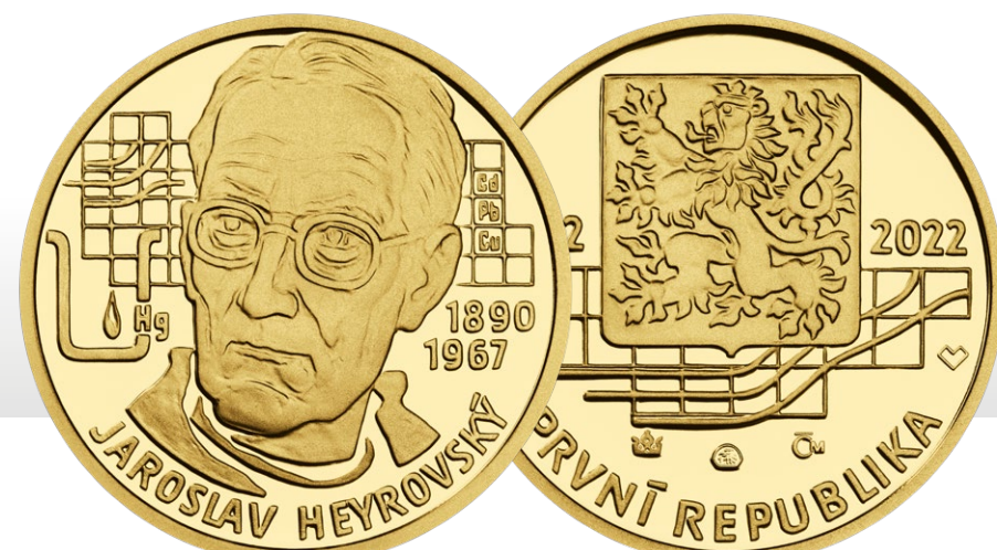
Dvoudukát průměru 25 mm

Španielovo autorství dvacetihaléře jsem vyjádřil jako dvě stopy - otisky, které vytvářejí kutálejší se mince. Tyto stopy začínají pod portrétem na reverzu, vybíhají z kruhového formátu a pokračují na averzu, kde jsou obě strany dvacetihaléře zachyceny. Symbolicky tak vyjadřují ideu, že se mince „rozkutálely“ do světa a nesmazatelně otiskly do novodobé československé historie.