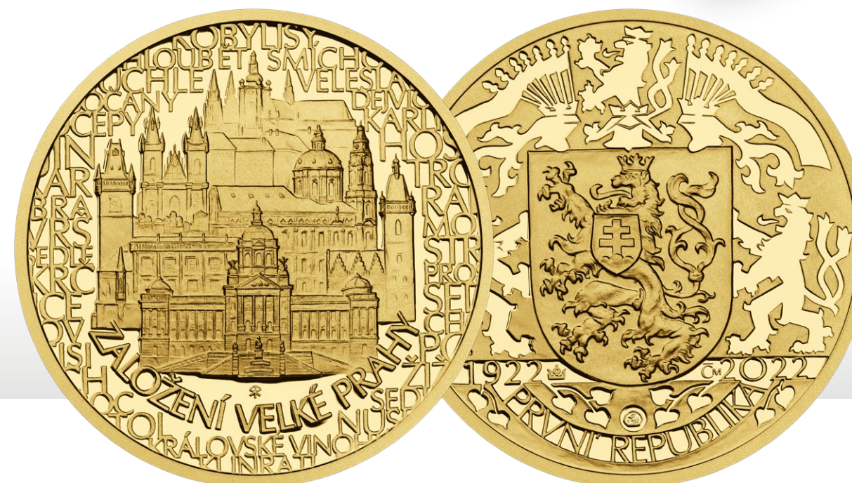
Pětidukát průměru 34 mm

Averzní straně podle dispozic dominuje štít s českým lvem, svou formou vycházející z heraldického názoru fungujícího v době mezi oběma světovými válkami. I zde jsou doplňkem abstraktní prvky evokující polarografii.