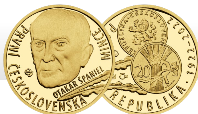
Dukát průměru 19,75 mm